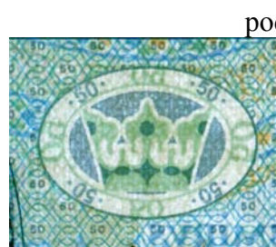
od strony przedniej