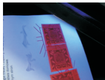
UV „krótki” - 254 nm znaczkii opłaty sądowej, dowody rejestracyjne