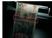
światło białe banknoty, dokumenty, znaczkii pocztowe